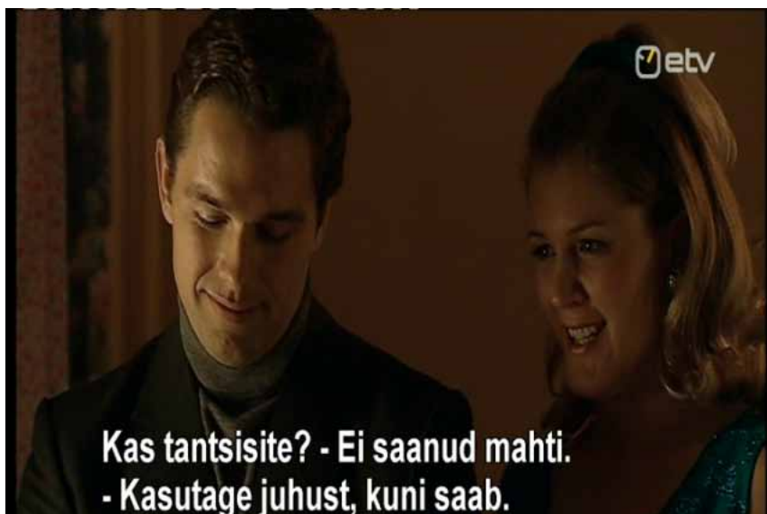
Joonis 3. Kõnevoorude vaheldumine ühes kaadris (seriaal „Maakonnahaigla”).